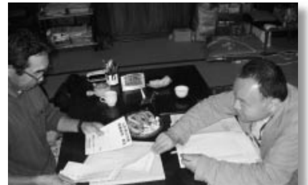
有機JASマークの使用状況のチェック

有機圃場として申請した圃場一覧表と栽培方法、栽培する作目、栽培する圃場の面積が一致しているか確認しています。