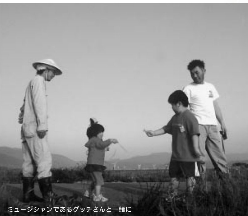
ミュージシャンであるグッチさんと一緒に

発行/ 〒999-7631 山形県鶴岡市八色木字西野338 tel.0235-78-2120 fax.0235-78-2140 http://www.shonaifarm.com