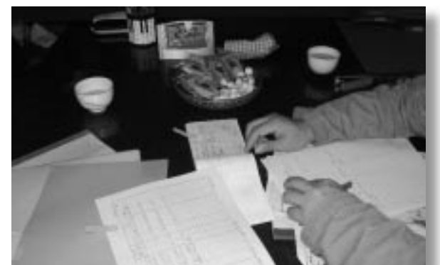
購入資材の伝票との照合

有機JASマークの使用に関しては、実際の使用枚数の管理も必要になりますので、その管理表のチェックを行っているところです。