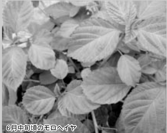
6月中旬頃のモロヘイヤ

ビタミン、ミネラル豊富なエジプト原産のモロヘイヤは今でこそ、どこのスーパーでも手に入るポピュラーな野菜ですが、日本に紹介されたのが二十数年前、本格的に栽培が始まったのは十数年前からです。高温多湿を好む野菜で全国どこでも栽培ができ、しかも害虫や病気に強い野菜です。それを、天日乾燥し粉末にしたのが『こな・モロヘイヤ』で、当法人設立当初頃からの息の長い商品です。 化学肥料、化学合成農薬を使用しないで栽培、生葉の乾燥も暑い最中の天日乾燥、製粉は注文に応じてそのつど行ないます。少人数のご家庭を考え一袋40g入