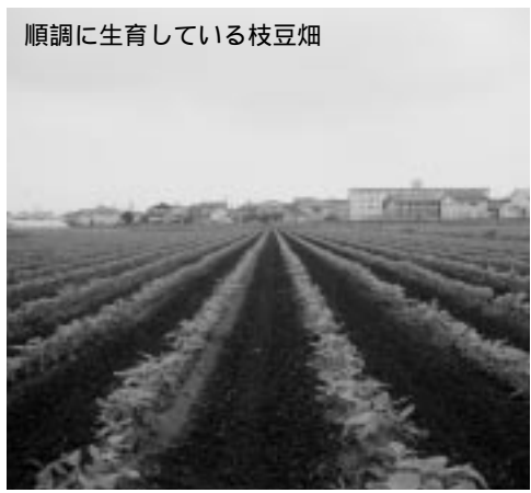
順調に生育している枝豆畑

つない晴天に恵まれ、特産品であるだちや豆も申し分なく育ってきてくれています。私としては、だちや豆だけが大きくなってくれると何より嬉しいのですが、自然はそんなに優しくなく、日々雑草との闘いです。私たちがでは、雑草を取りきることは無理なので、大学生に手伝ってもらっています。ある子は無心になり、もくもくと仕事をし、ある子は手より口が動いて