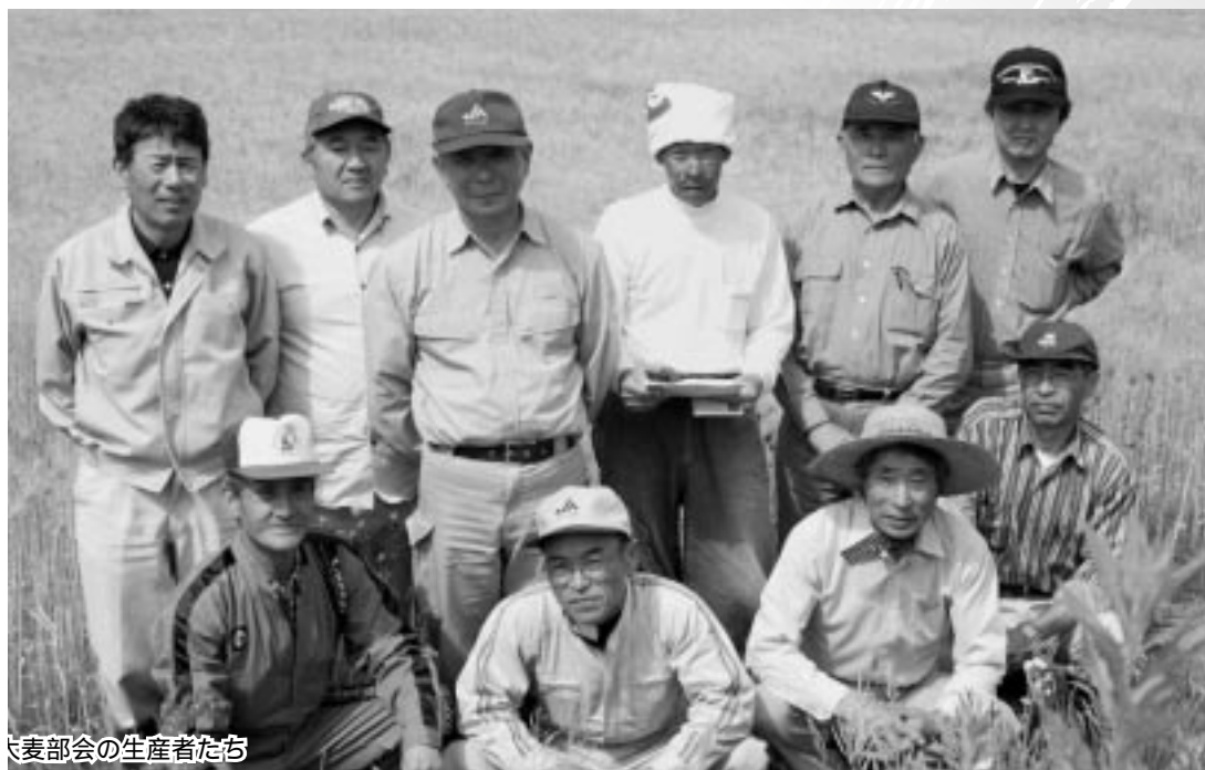
麦部会の生産者たち

発行/ 〒999-7631 山形県鶴岡市八色木字西野338 tel.0235-78-2120 fax.0235-78-2140 http://www.shonaifarm.com